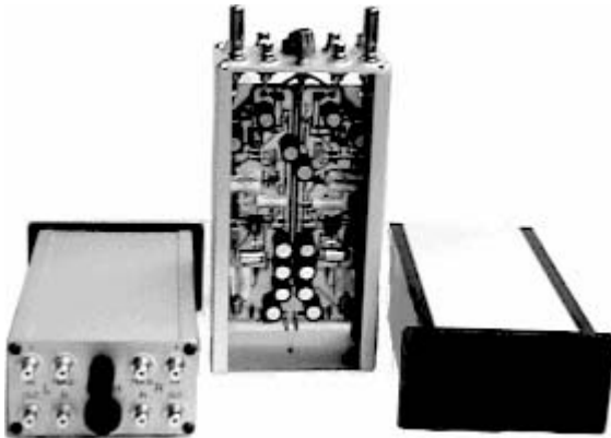
Ansicht von hinten, innen und vorn

Entdecken Sie Ihre Schallplattensammlung neu!