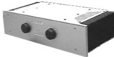
Abbildung: Probus ohne Netzteil EPS+