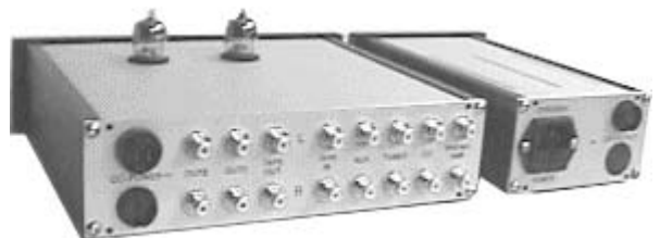
Ansicht von hinten, hier Röhrenversion mit externem Netzteil EPS

Lassen Sie sich durch einen Hörtest überzeugen!